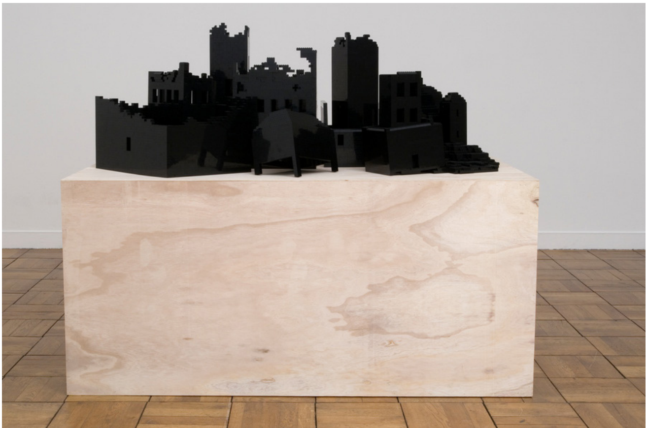
Myriam MECHITA, Territoires rêvés, briques de construction sur socle en bois, 2008.