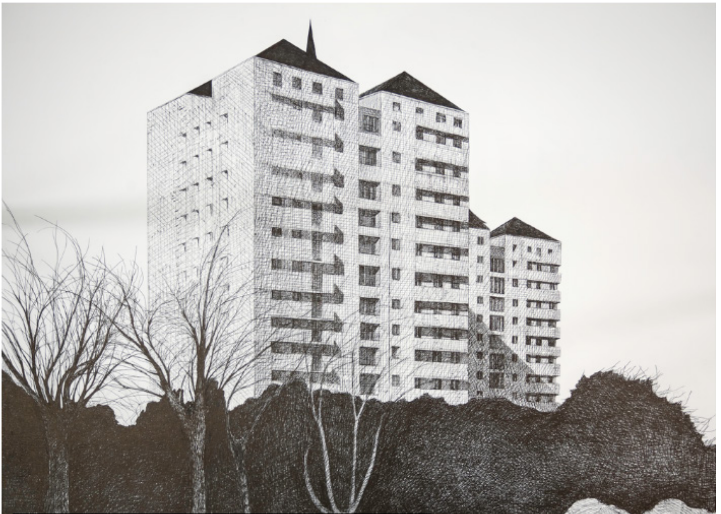
François TROCQUET, sans titre, dessin stylo bille sur papier, 2018.

Public visé : collèges, Atelier adaptable aux publics spécifiques (EHPAD, réinsertion, classes ULIS...).