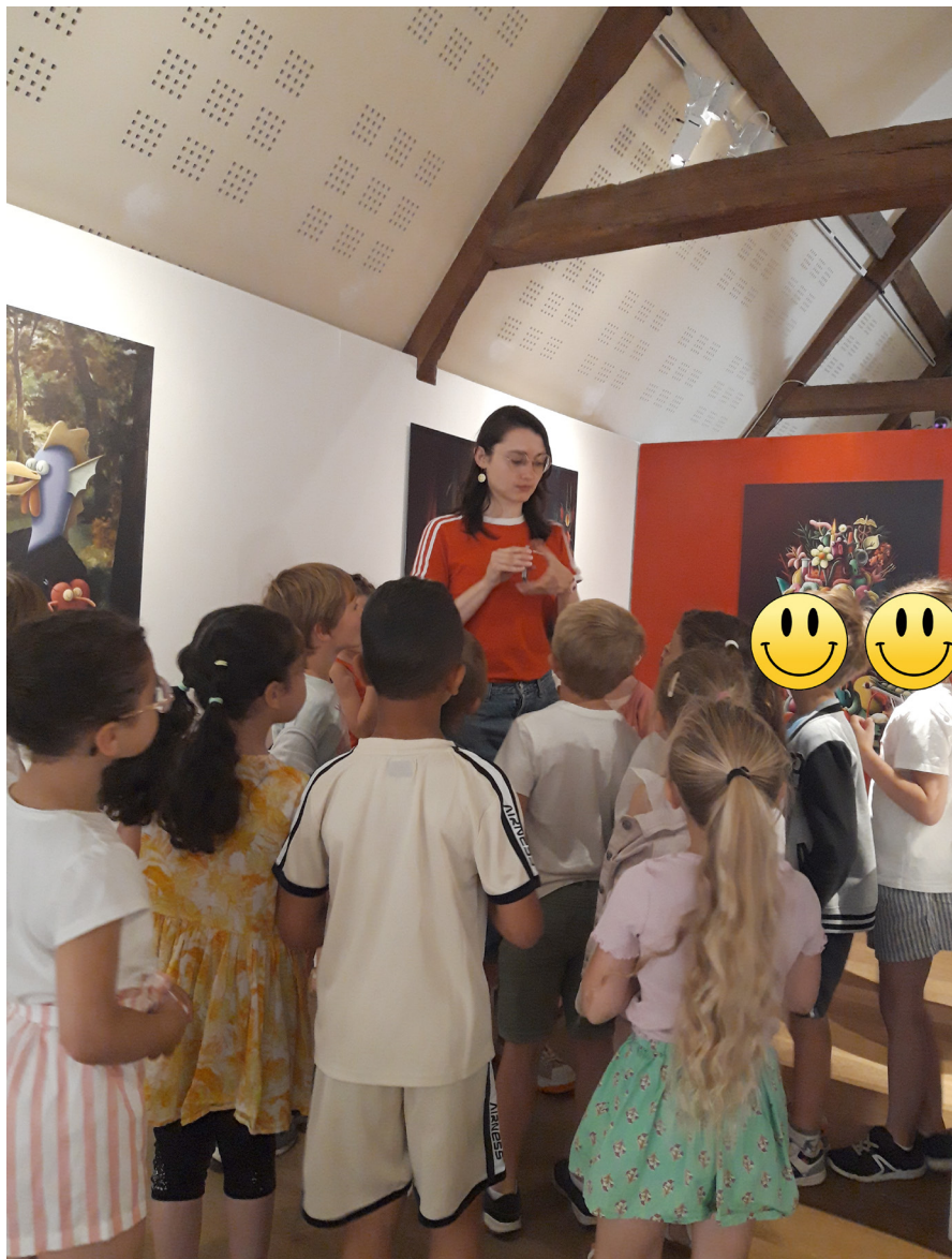
Visite commentée de l'exposition Polymorphe.

_ A partir de la GS, l'atelier s'accompagne d'une visite classique adaptée à l'âge et au niveau des enfants. (45 minutes de visite + 45 minutes d'atelier)