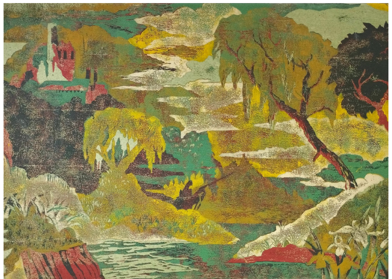
Aventures , linogravure et huile sur toile, 50x70cm, 2025.

Et lors de votre périple, accordez-vous une halte au centre d'art des Dominicaines afin d'y découvrir le reste de son œuvre, riche en couleurs et en verdure.